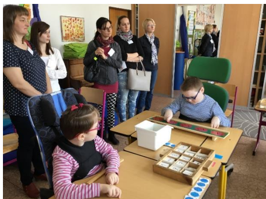
Detektivní kancelář Brouk a Babka

Výsledkem šetření tohoto případu bylo zjištění, že si to všichni náramně užili a rádi si to příští rok zopakují.